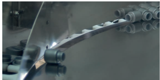
Détail de l'intérieur du redresseur POSIPHARMA-13

Les bouteilles sont acheminées vers le redresseur par un convoyeur élévateur. Elles sont ensuite réparties sur le disque rotatif supérieur (1) afin d'être placées dans les alvéoles des pièces de sélection (2). Il n'y a pas d'intervention mécanique, l'effet de l'air et la gravité suffit.