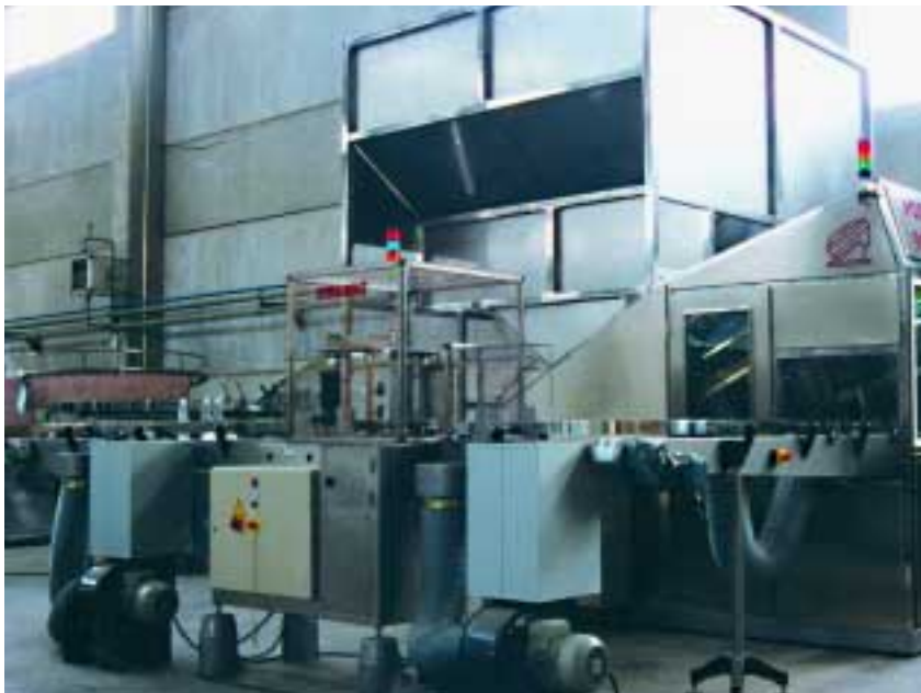
Silo Posisilo, redresseur Posimat et orienteur Giramat.

Il est très adapté quand l'espace est très réduit. Il existe dans les versions B , D et Vision , qui dans leur version standard sont des unités autonomes qui ont leur propre convoyeur de sortie.