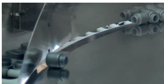
Dettaglio dell'interno del riordinatore POSIPHARMA-13

Le bottiglie entrano nel riordinatore attraverso un elevatore. Si dispongono sul disco rotativo superiore (1) in modo da collocarsi sulle cavità dei selettori (2). Ciò si ottiene senza nessun tipo di aiuto meccanico: semplicemente con aria e per la forza di gravità.