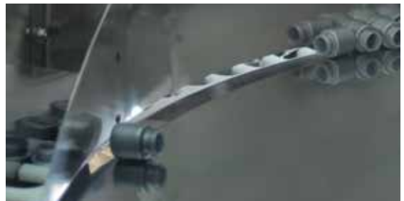
POSIPHARMA款-13型理瓶机内部细节

容器或瓶盖通过升降料斗进入理瓶机，在顶部转盘（1）中分配完毕后落入转盘边缘的“选定槽”（2）中。理瓶过程中不会对容器或瓶盖进行任何可能对其造成损伤的机械操作，所有容器或瓶盖均以压缩空气或自身重力移动。